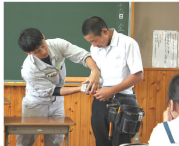
腰につける工具入れをを試しに 装着したがずしりと重い