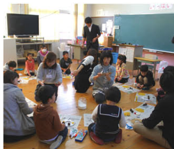
リースのほかに作った松ぼっくりのツリー作りには参加者は真剣そのもの