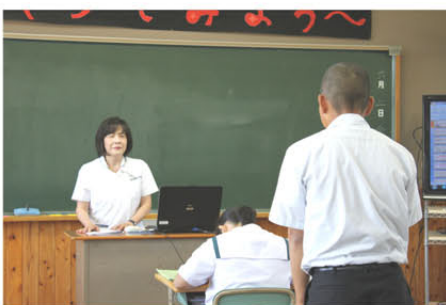
看護とはただその仕事ではなく、思いやりの心で接するのも看護の仕事と教わる