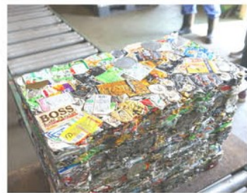
アルミの空き缶は厚さ10cmで15kgの固まりに圧縮。写真はそれを数段積んでいる。

で、公害防止対策に万全を期したもので、コンピュータで常時監視しています。研修室でのゴミ処理の行程などの説明を受けた後、施設内を見学しました。家庭から出されるゴミの焼却施設や、リサイクルに回す処理、分別されたゴミの行方などについて学びました。焼却施設の煙突からは、多くの工程を経て有毒なも